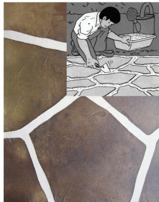
Betoniranje i ukrašavanje betonskih staza