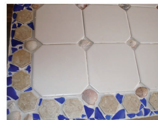
Fugovanje i ukrašavanje pločica