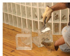
Lepljenje staklenih površina